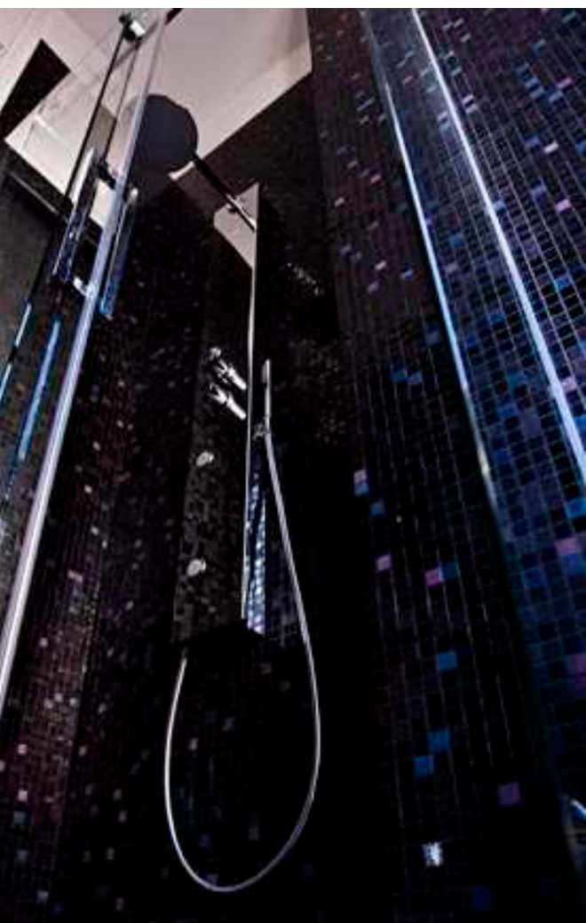
Doccia / Shower: DECOR FLUIDA / LOOK , Glass Mosaico / Mosaic: Trend