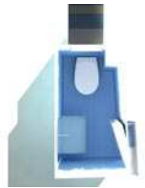
Lavabo /Sink: STEEL FREESTANDING , LAGO Sanitari / Sanitary: S50 , Vitra Ceramiche / Tiles: MOSAICO FEEL , Trend Rubinetterie / Tap: AXOR CITTERIO , Hansgrohe